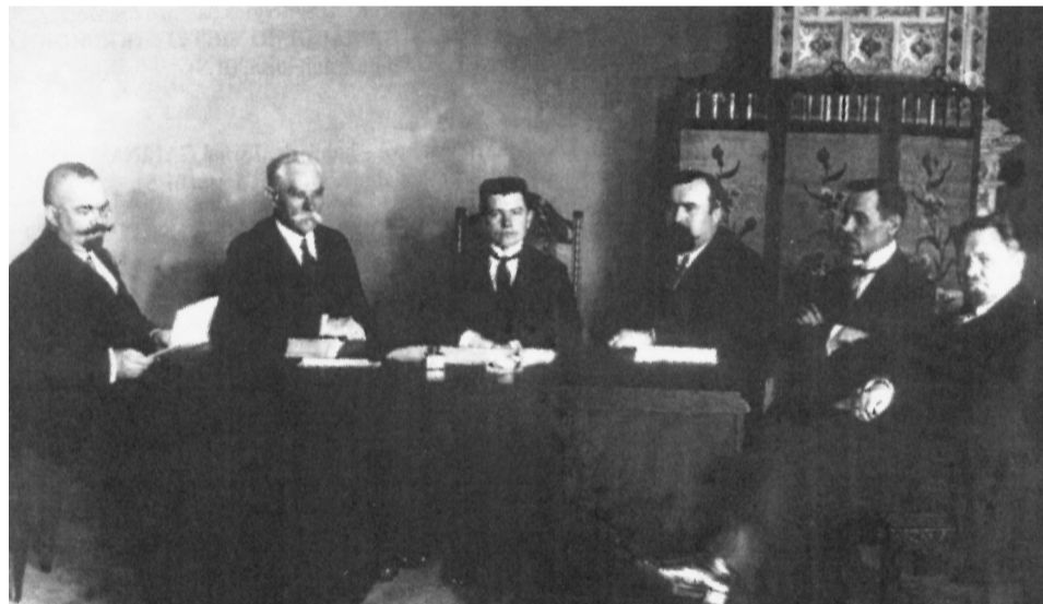
Pirmoji Nepriklausomos Lietuvos Vyriausybė (iš kairės): J. Yčas – Švietimo ministerijos valdytojas, P. Leonas – teisingumo ministras, A. Voldemaras – Ministras Pirmininkas ir užsienio reikalų ministras, M. Yčas – finansų ministras, J. Tūbelis – žemės ūkio ir valstybės turtų ministras, V. Stašinskas – vidaus reikalų ministras.

Kai Lietuvos Valstybės Tarybos prezidiumas 1918 m. lapkričio 11 d. paskyrė pirmąją nepriklausomos Lietuvos Vyriausybę, vadovaujamą profesoriaus Augustino Voldemaro, joje buvo ir du Yčai: švietimo ministras Jonas Yčas ir finansų ministras Martynas Yčas. Švietimo ministro pareigas J. Yčas ėjo trijuose ministrų kabinetuose iki 1919 m. balandžio 12 d.