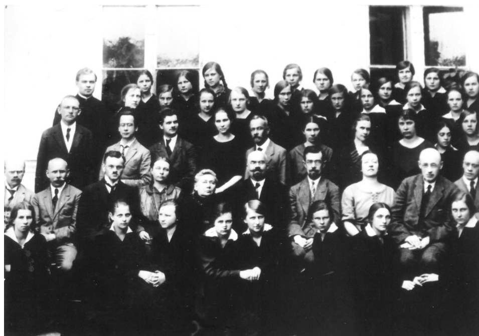
Panevėžio mergaičių gimnazija. Viduryje – direktorius J. Yčas ir mokytoja Gabrielė Petkevičaitė-Bitė.